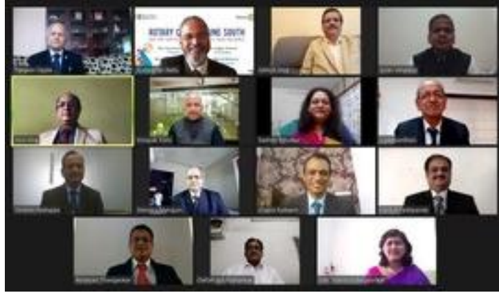
New Normal group photo BoD 2020-21