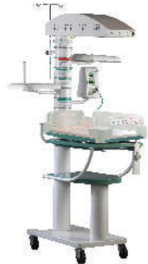
JEEVAK Servo Open Care Incubator