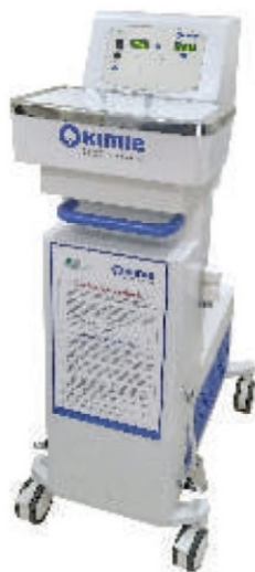
KIMIE Human Milk Pasteurizer