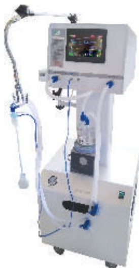
NEONATAL VENTILATOR Model: Shreeyash SW21