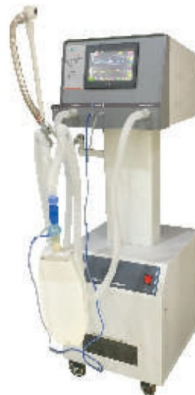
ADULT VENTILATOR Model: Shreeyash 900